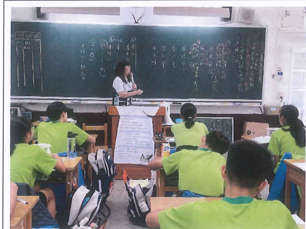
說明：教師講解文本內容