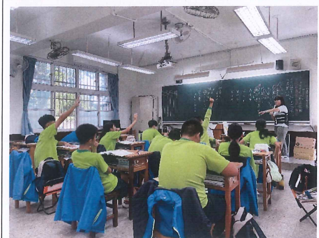
說明：學生上課踴躍回答問題