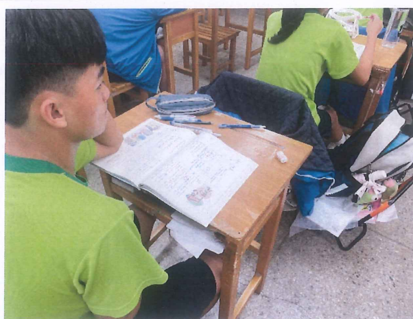
說明：學生聆聽並思考他人發表之看法