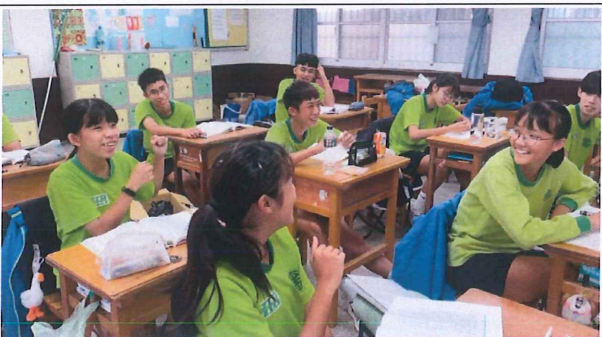
說明：學生上課投入，彼此互動良好