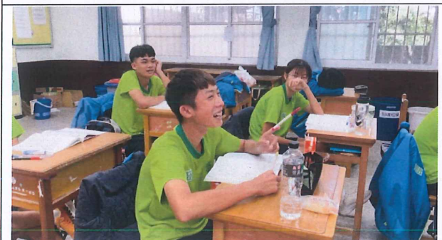
說明：學生說明錯誤經驗，笑果十足