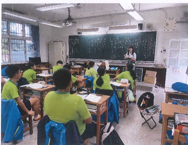
說明：師生上課互動氣氛融洽